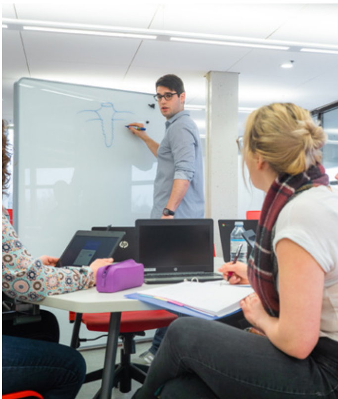
Des tableaux muraux et mobiles font partie du mobilier offert à l'Espace Moebius.

d'équipe. L'un des objectifs de l'Espace Moebius consiste d'ailleurs à offrir aux étudiants l'occasion de vivre des situations d'apprentissage variées, susceptibles de maximiser leur participation vers l'atteinte d'une maîtrise de leurs compétences. »