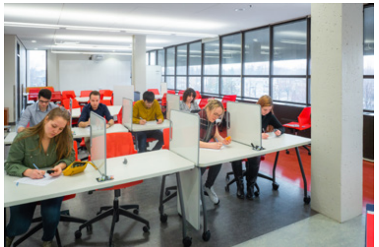
Le mobilier de l'Espace Moebius est facilement adaptable à divers besoins.