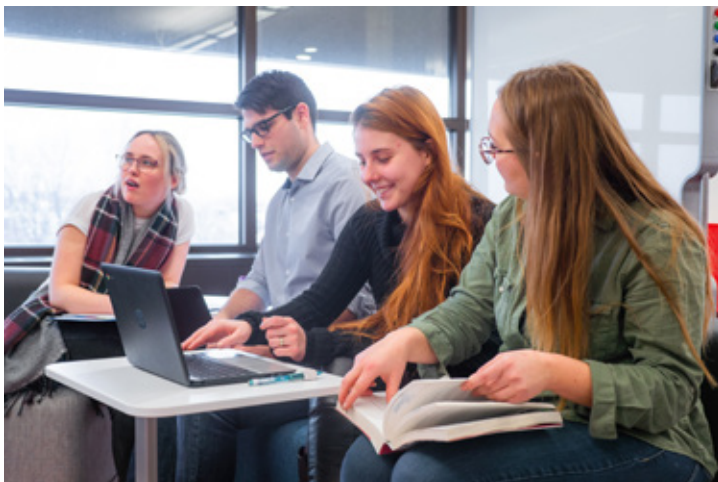
L'Espace Moebius est avant tout un lieu favorisant la collaboration.

« Les étudiants vivront des expériences qui enrichiront leur parcours éducatif, souligne-t-elle. En plus de leur permettre de perfectionner leurs compétences technologiques, un lieu comme celui-ci leur offre la chance de développer des qualités devenues essentielles sur le marché du travail comme la collaboration, la créativité et le travail