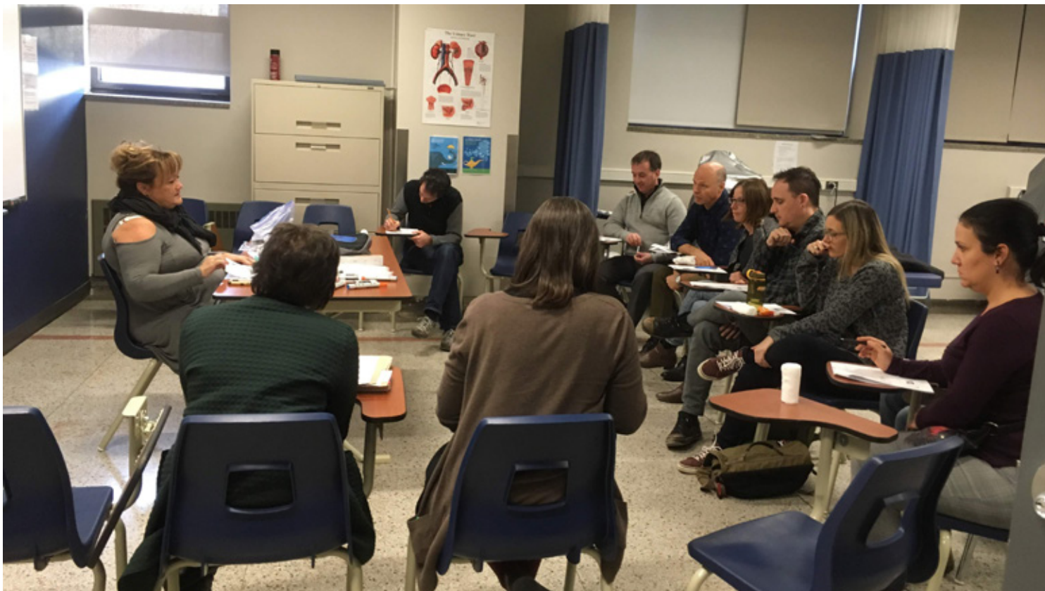
La formation complète a permis aux accompagnateurs de partager leur expérience et d'échanger entre eux.

en décembre 2018, une représentante de la Direction des affaires internationales (DAI) de la Fédération des cégeps et la responsable de la mobilité étudiante du Cégep Marie-Victorin ont assisté aux activités de la matinée pour s'inspirer des pratiques de notre Cégep.