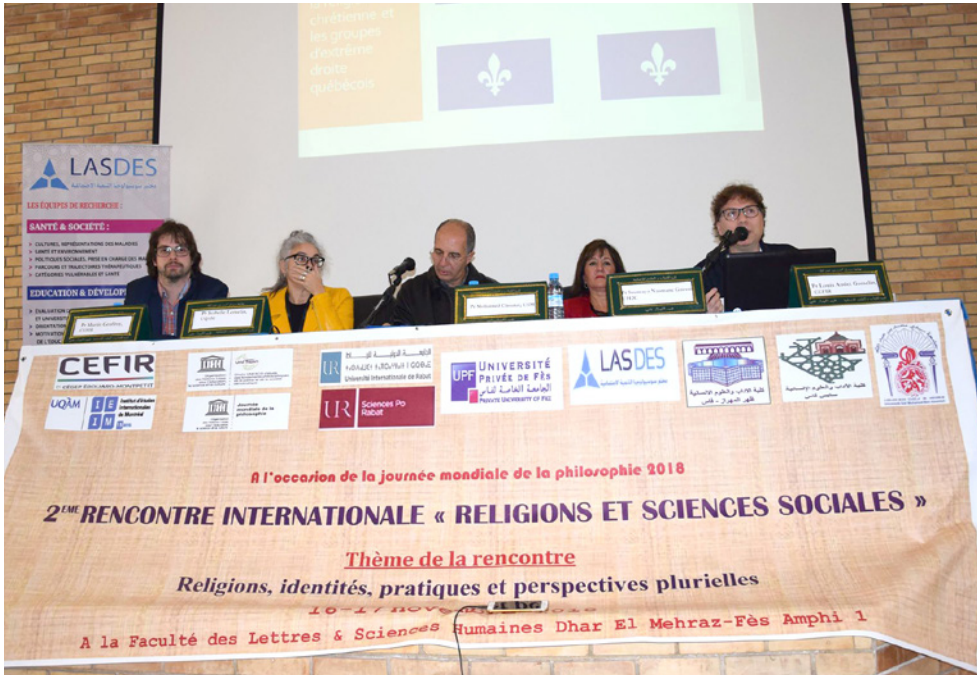
L'événement au Maroc a permis à l'équipe du CEFIR de participer à divers panels pour enrichir les discussions.