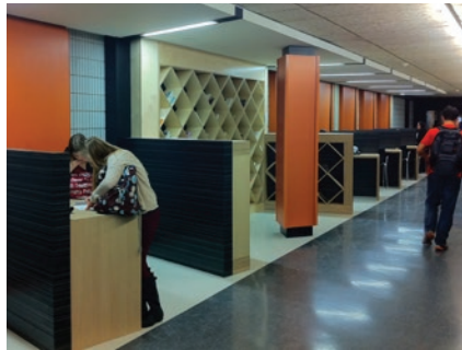
Saviez-vous que c'est du désir de réduire le bruit sur le Boulevard des écrivains du campus de Longueuil, exprimée dans un sondage «Un Cégep à notre santé!», qu'est née l'idée de créer un nouvel environnement d'étude à cet endroit? Aménagée depuis l'été dernier, cette réalisation est, entre autres, le fruit d'une collaboration du Département de littérature et de français, du Département de philosophie, de la Direction des communications, de la Direction des affaires étudiantes et communautaires et de la Direction des ressources matérielles.